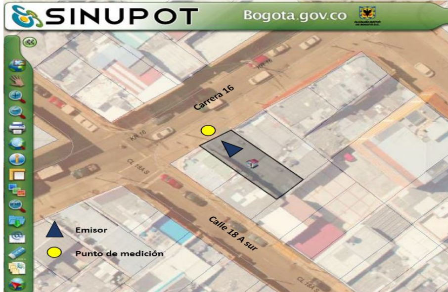
Figura 1. Ubicación del predio emisor y punto de monitoreo.